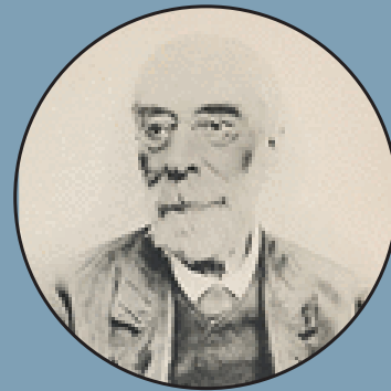
Charles Renouvier (1815-1903) est un philosophe.